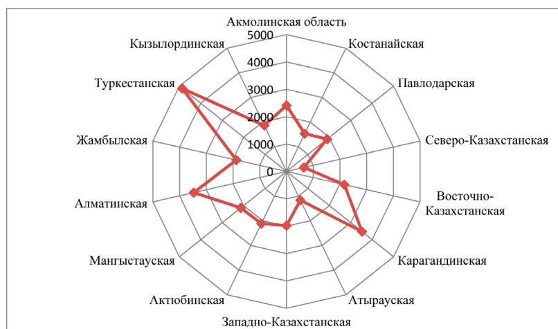
Рисунок 1 – Итоги расчета интегральной оценки потенциала развития сакрального туризма Казахстана по административным областям на основе экспертной оценки

менением метода баланса показал неравномерность распределения потенциала по территории страны (рисунок 1).