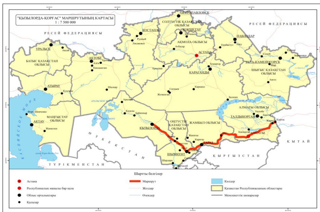
1 сурет – Қызылорда-Түркістан-Шымкент-Тараз-Алматы-Қорғас (Хоргос) маршруты

«Батыс Еуропа-Батыс Қытай» жол торабы бойында орналасқан ара қашықтығы 1390 километр болатын Қызылорда-Түркістан-Шымкент-Тараз-Алматы-Қорғас (Хоргос) жолдары арқылы көшпелі туризм түрін ұйымдастырудың болашағы зор (1 сурет) (Западная Европа – Западный Китай. Международный транзитный коридор 2016).