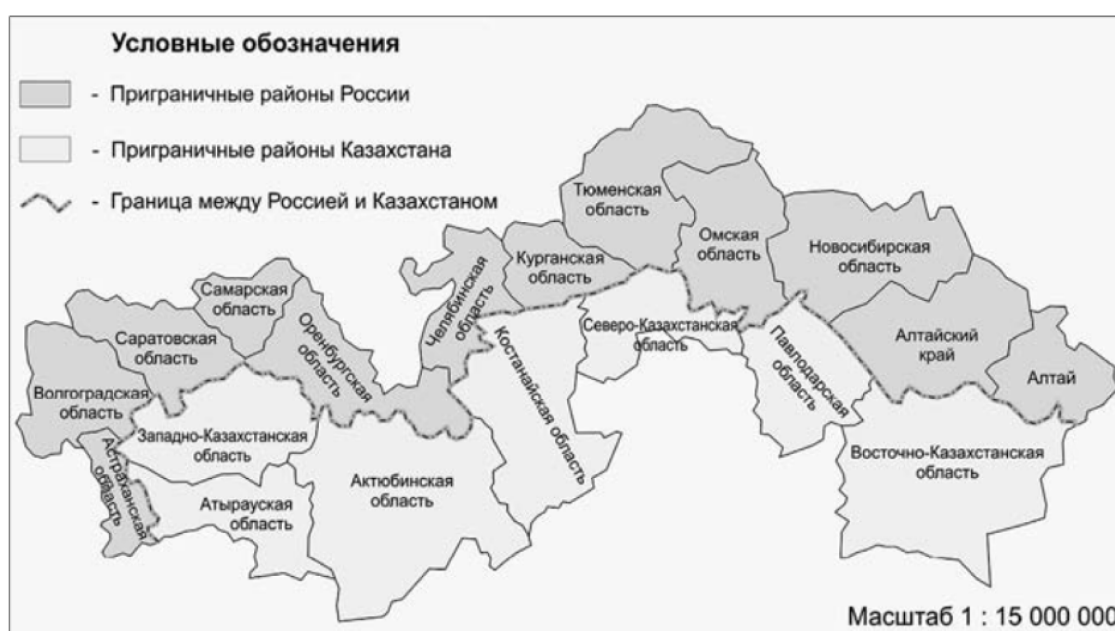
Рисунок 1 – Приграничные регионы Российской Федерации и Республики Казахстан

Российско-казахстанский приграничный регион включает 12 регионов Российской Федерации (Астраханская, Волгоградская, Курганская, Новосибирская, Омская, Оренбургская, Саратовская, Самарская, Тюменская, Челябинская области, Алтайский край и Республика Алтай) и 7 областей Республики Казахстан (Актюбинская, Атырауская, Западно-Казахстанская, Костанайская, Павлодарская и Северо-Казахстанская области) (рисунок 1) (Носонов, 2016:344).