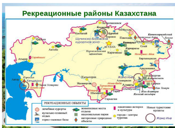
2-сурет – Қазақстанның негізгі рекреациялық аудандары (Плохих 2011)

Туризмнің дамуы рекреациялық аймақтардың